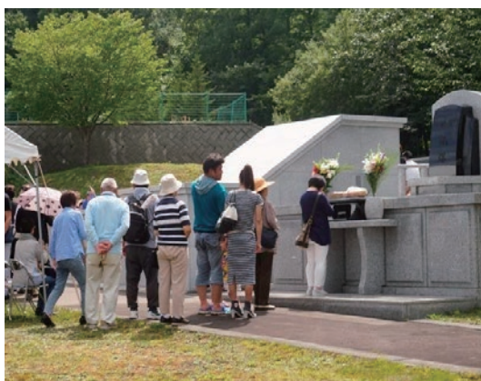
写真3 合祀塔（2016年8月15日）