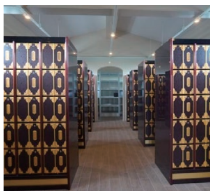
写真6 手前がカロートで、正面奥が納骨棚（遺族は、納骨時しかここへは入れない）

2017年より毎年9月に、僧侶による合同供養を実施することになっている。安置期間が過ぎれば、遺骨は合祀塔へと移される（写真7）。合祀料は5万円。