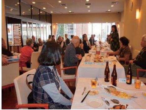
写真9 契約者・遺族の新年昼食会の様子（2017年1月18日）