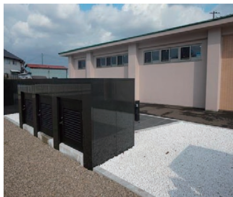
写真7 合祀するスペース（前方が手をあわせる場所、遺骨を合祀する場所は白い砂利部分の地下）