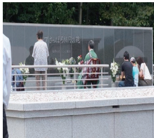
写真2 「協同の苑」（2016年8月15日）