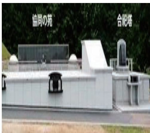
写真1 「協同の苑」と合祀塔の位置関係

協同の苑には納骨室が 300 個あるが、利用が増えて空きが少なくなっていることと跡継ぎがないなど親族にお参りの負担をかけたくない、という声を受け、2011 年には合祀塔を建て、34 年後は合祀塔に改葬される仕組みとなった。また希望によって、34 年を待たずに協同の苑から合祀塔に移ることができるほか、直接合祀塔に埋葬することも可能となった。